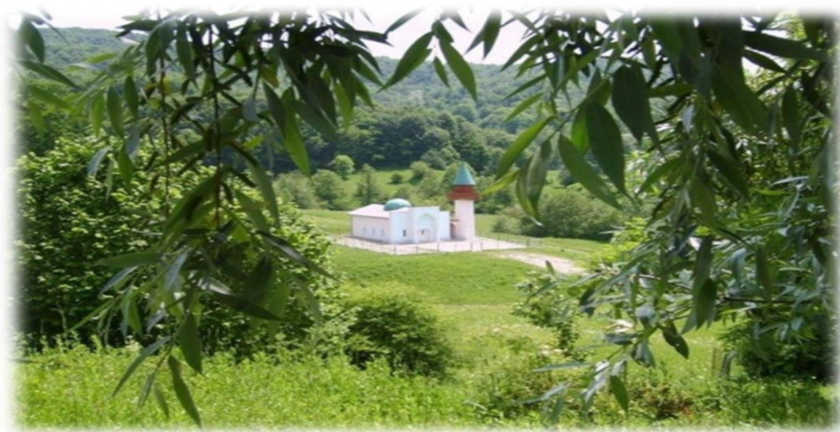
Stațiunea Vulcana Băi

Vulcana Băi reprezintă una din localitățile județului Dâmbovița cu un potențial turistic balnear și climateric deosebit, recunoscută pe plan european pentru apele minerale iodurate, ocupând locul II în Europa din acest punct de vedere.