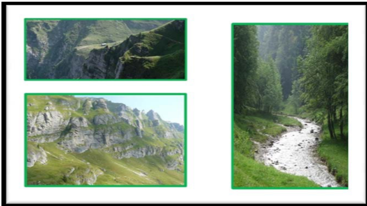
Parcul Natural Bucegi